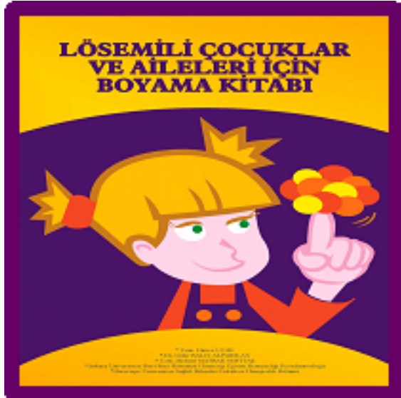
Resim 2: Lösemili Çocuklar ve Aileleri İçin Boyama Kitabı

Bilgiler hikaye diliyle yazılmış, resimler bir ilustratör tarafından çizilmiş ve boyama kitapçığı haline getirilmiştir. Çizimler ve basım, Türk Kulak Burun Boğaz ve Baş Boyun Cerrahisi Derneğinin sponsorluğunda gerçekleştirilmiştir.