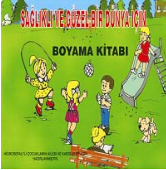
Resim 1: Hidrosefalili Çocuklar ve Aileleri İçin Boyama Kitabı