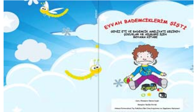
Resim 3: Kitapçık kapağı

Resim 4-11: Kitapçık sayfalarından örnekler